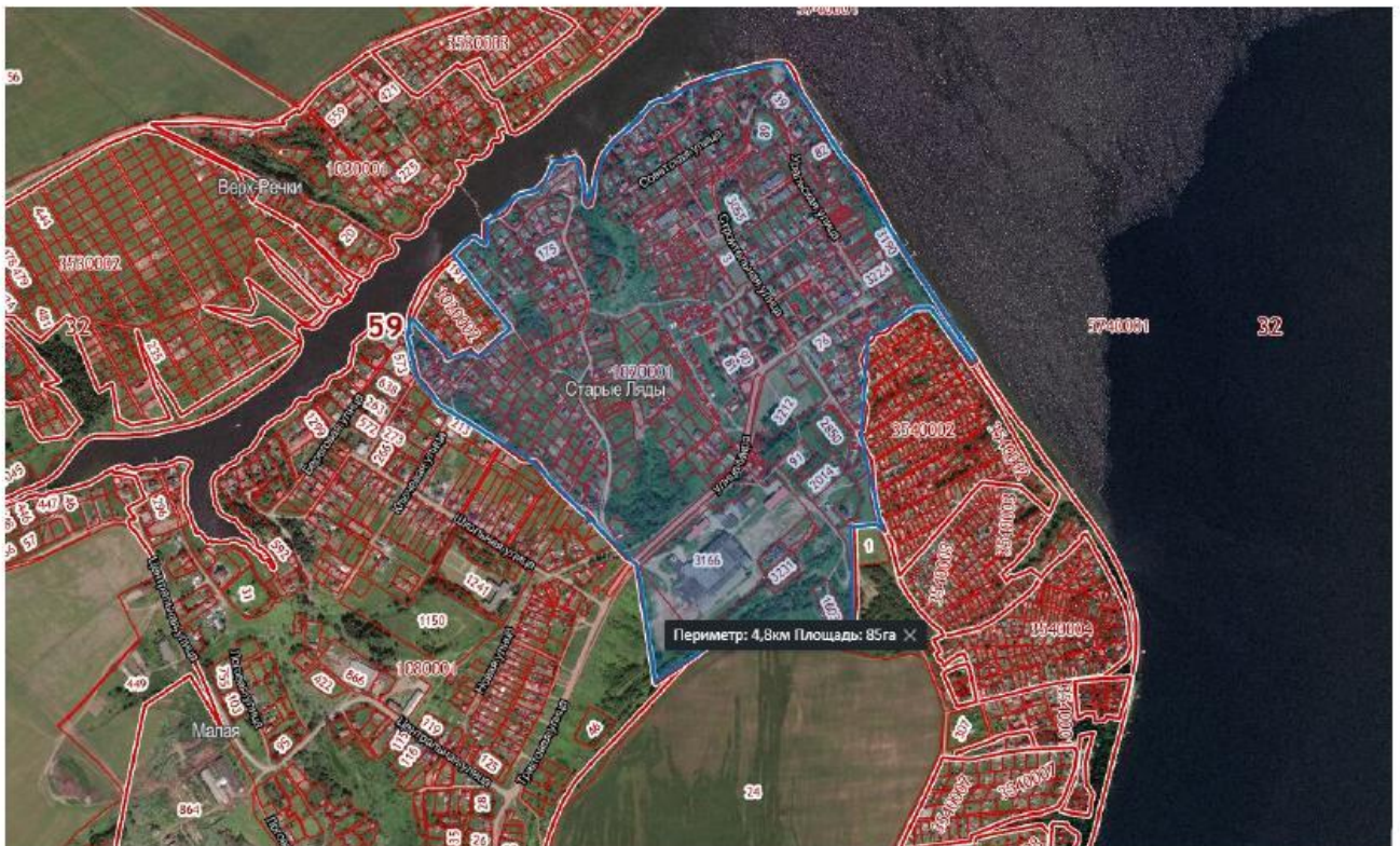
Схема для разработки проекта межевания территории кадастрового квартала 59:32:1020001 с. Ляды Сылвенского сельского поселения Пермского муниципального района Пермского края